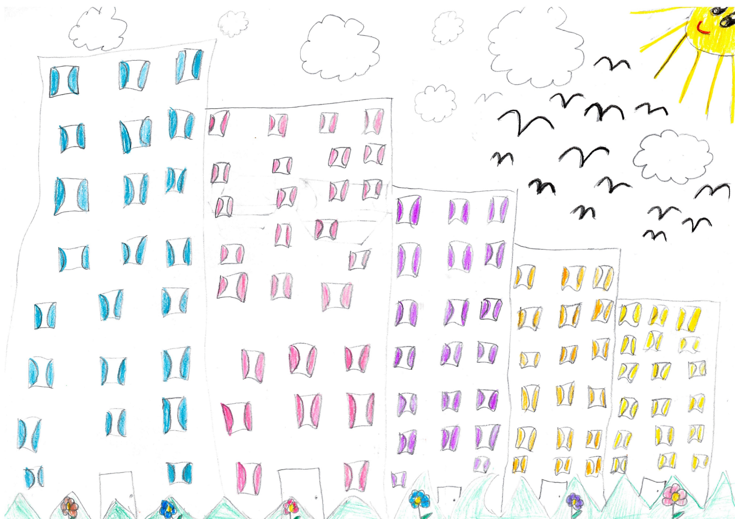
Christie, 9 ans

Et tous les bénévoles et personnes qui donnent de leur temps, des idées, des coups de main ou simplement un sourire au quartier !