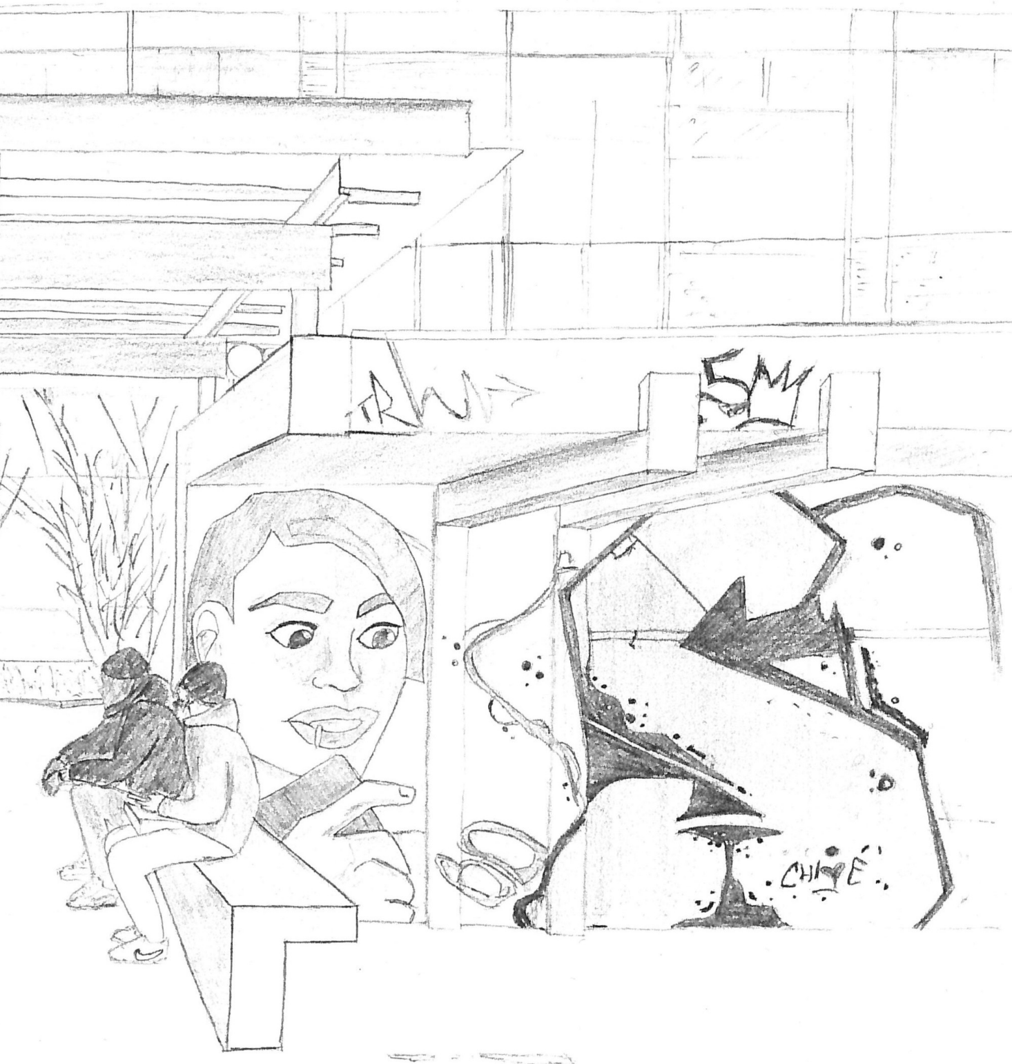
Lenny, jeune du quartier et étudiant en architecture